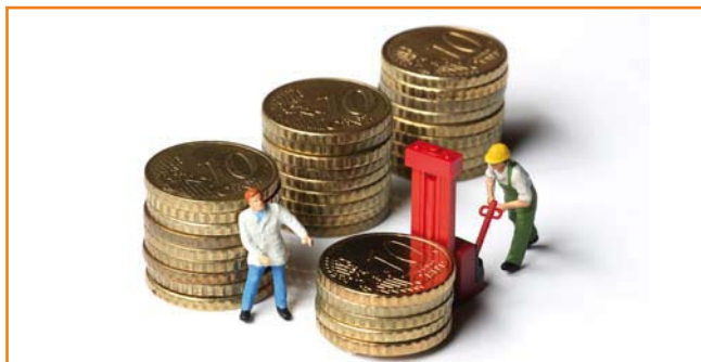
Les propositions du gouvernement augurent mal de ce qui doit se faire pour la catégorie A.

Après plusieurs réunions d'un groupe de travail des signataires piloté par la DGAFP (Direction générale de l'administration et de la Fonction publique), une ultime réunion du comité de suivi a eu lieu le 15 décembre dernier. Celle-ci était présidée par André Santini, secrétaire d'État chargé de la Fonction publique. L'Uffa-CFDT a pu noter quelques avancées positives sur certaines de nos revendications, notamment celles relatives au reclassement des agents. La discussion sur l'allongement des carrières a également fait l'objet d'une proposition plus