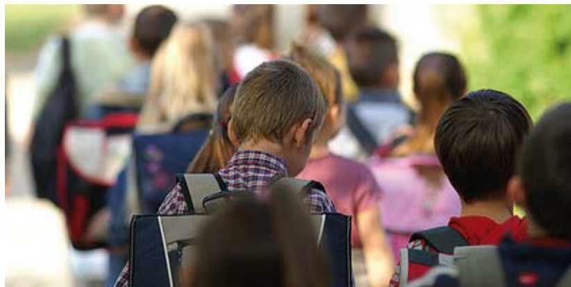
Diminuer l'accueil des élèves et/ou augmenter leur nombre dans les classes sont les conséquences directes des choix actuels.

Mais pour arriver au niveau de suppressions prévues par le budget, il faut trouver d'autres gisements : outre la baisse du nombre de stagiaires (moins de postes au concours) il y aura la disparition de 1 000 équivalents temps plein utilisés précédemment pour des mises à disposition ou des décharges de service dont une bonne partie, indispensables au fonctionnement du système, seront très certainement remplacées par des heures supplémentaires. Enfin c'est 3 000 emplois consacrés