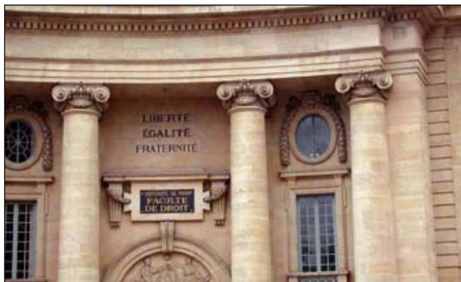
Les enseignants chercheurs attendent des mesures adaptées.

Depuis mai 2007 l'enseignement supérieur et la recherche sont présentés comme une priorité nationale, une multitude de réformes et d'initiatives du gouvernement n'ont pas répondu à l'attente des personnels. Aujourd'hui le mécontentement est grandissant.